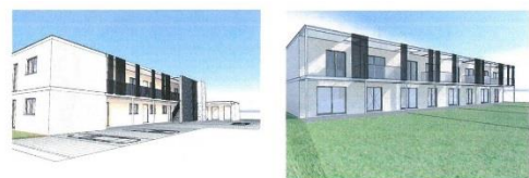
Trompwegel De Klinge