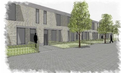
Kemzekestraat te Kemzeke (8 eengezinswoningen)