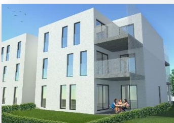
Kemzekestraat te Kemzeke (10 appartementen)